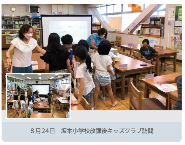
8月24日 坂本小学校放課後キッズクラブ訪問

こちらは、低学年の児童さんが多いので、内容も少し変えて行っています。子ども達は、とても素直に税について考えてくれて、私たちが気づかされることもあります。また、学習後には「税に関する絵がきコンクール」にも取り組んでくれました。