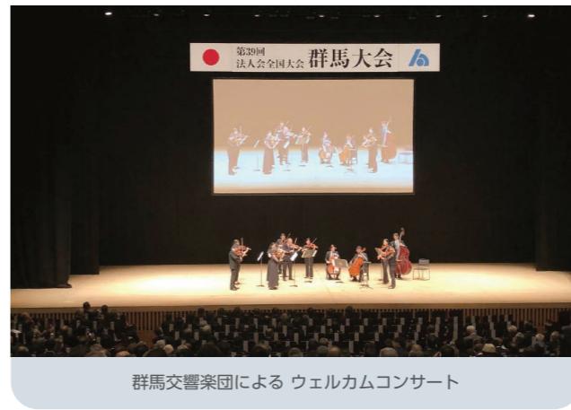
群馬交響楽団による ウェルカムコンサート

最初に、群馬県が誇る『群馬交響楽団』によるアンサンブル編成でのウエルカムコンサートに始まり、優美な楽曲で大いに盛り上がりました。