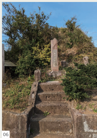
04. 本堂越しの見晴らし/05. あ、本堂の横に/06. 富士塚が

富士山を昇ったご利益があるとも言われており、その説が正しいのかは確認出来ませんが、あると良いですね。 富士山神社、皆さんも訪れてみてはいかがでしょうか。