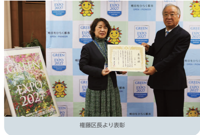
権藤区長より表彰