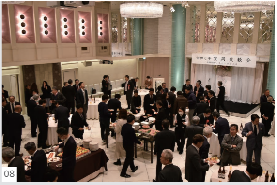
08. 新年賀詞交歓会の様子