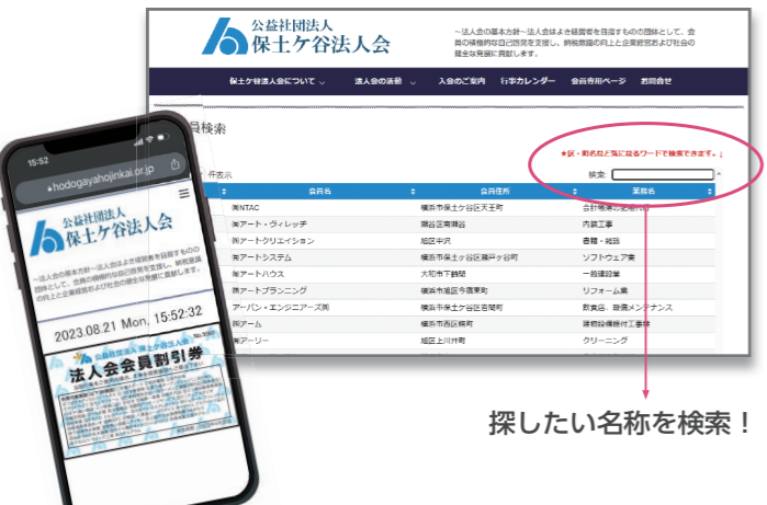
探したい名称を検索！

多くの会員のみなさまにご利用していただきますよう、日々アップデートを重ねております。是非、お役立ていただけますよう、よろしくお願致します。