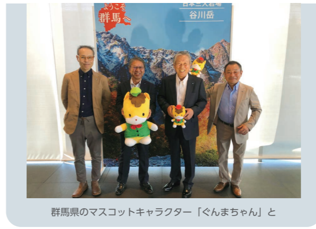
群馬県のマスコットキャラクター「ぐんまちゃん」と

最後に会員増強表彰式では、コロナ禍の中、令和4年における会員数が1社以上という事で、当会は「努力賞」を受賞いたしました。これは県下では唯一の偉業となります。