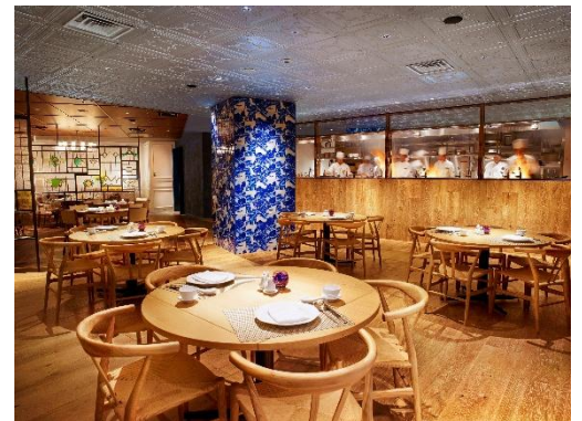
ランチ会場（ヒルトン東京・王朝）